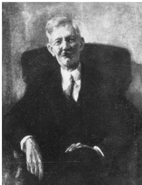
13. ábra: Udvary Pál Vaszary Gábor portréja

Vaszary Gábort – sok más művészhez hasonlóan – az emigrációt követően kizárták a magyar szellemi életből. Noha folyamatosan dolgozott, könyvei nem jelenhettek meg Magyarországon. Az emigrációban működő magyar kiadók (Kárpát, Pannónia, Amerikai Magyar Kiadó) több régi sikerkönyvét kiadták, míg újabb írásai nagyobb példányszámban németül és más nyelveken láttak napvilágot. A 80-as években még mindig aktív: a cleveland-i magyarok irodalmi, művészi és tudományos életének egyik fóruma, az Árpád Akadémia irodalmi fősztálya számára dolgozott. Tagja volt a PEN Club németországi tagozatának és bestsellereivel folyamatosan nemzetközi sikereket ért el. Munkásságának utolsó