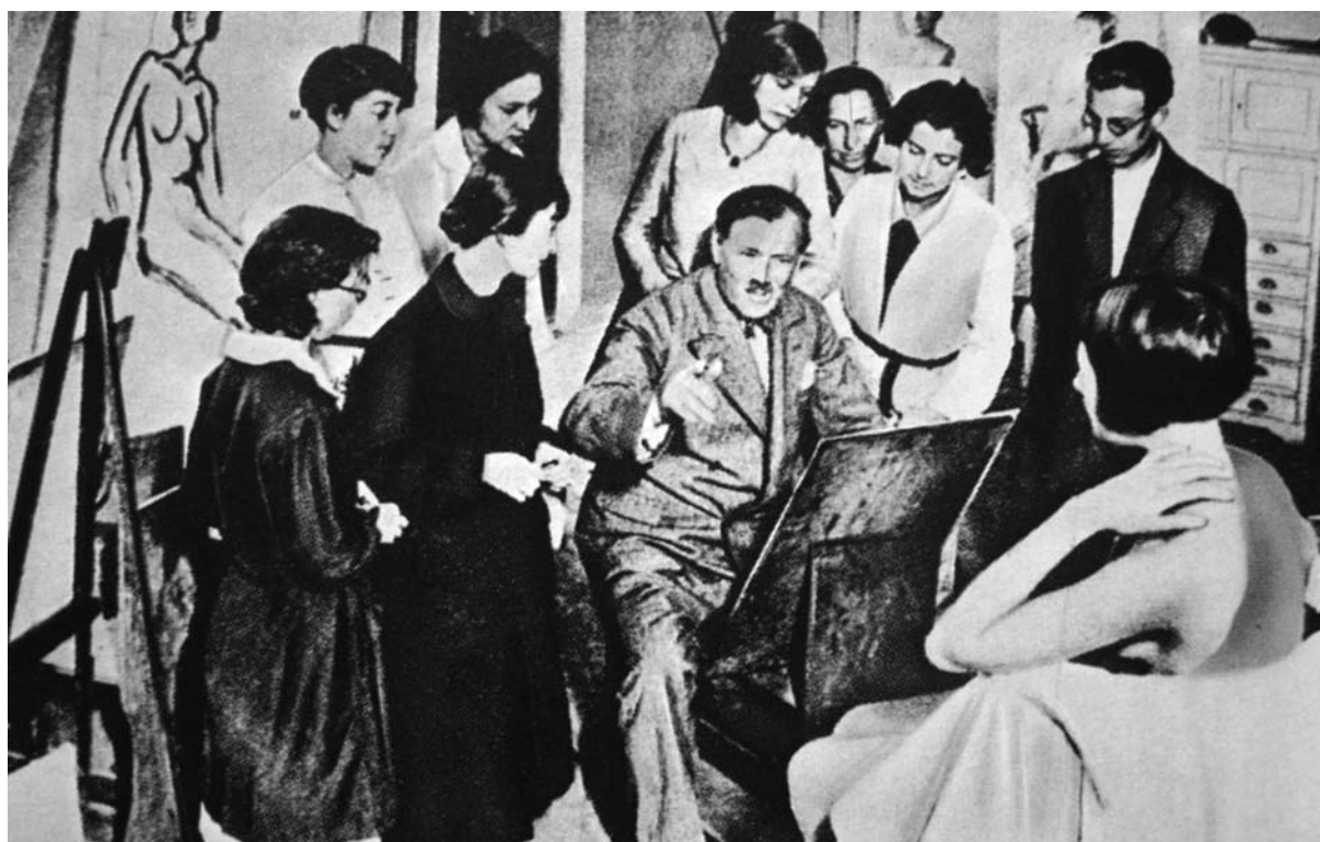
7. ábra: Vaszary tanítványai között