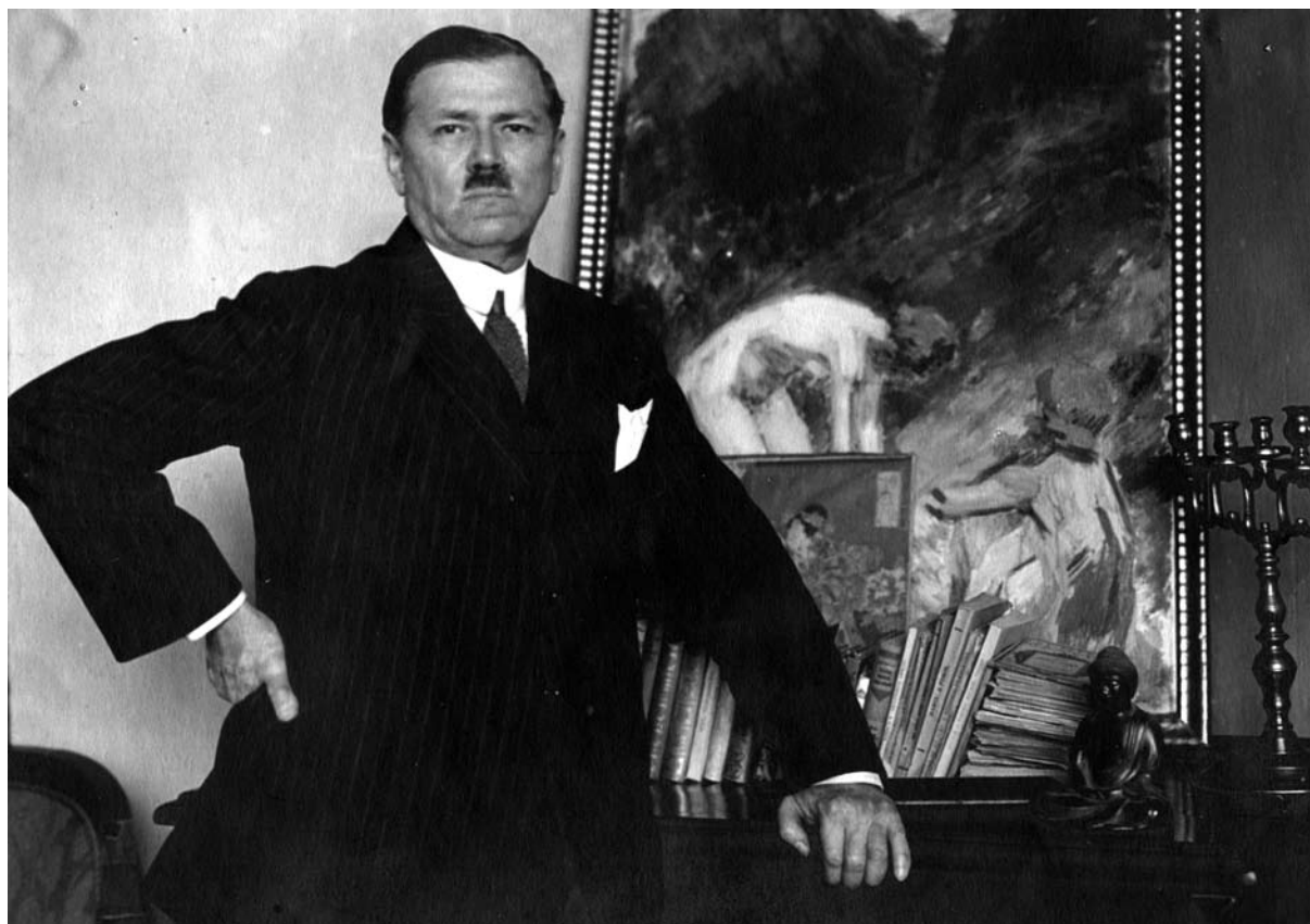
6. ábra: Vaszary János festőművész a műtermében