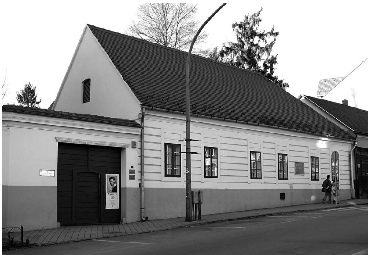
4. ábra: Vaszary János szülőháza Zárda utcában

valósággal elüldözött hazulról – és örültem, midőn másutt folytathattam a tanulmányaimat.” 31 Korán, 15 éves korában elkerült a szülővárosból, mert apja Kolozsvárra, az ottani piarista gimnáziumba küldte tanulni.