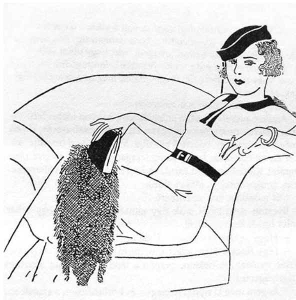
12. ábra: Vaszary Gábor illusztrációja az „Ó” c. regényéhez

színházak. Darabjait többnyire öccse, a szintén író (és színiigazgató) János rendezte, és a Vaszary-fivérek műveiben rendszeresen szerepelt Piroska húguk, valamint János felesége, Muráti Lili is. Gábor színészként is bemutatkozott, Ráday Imre főszerepét vette át az Új Színház A férfi ingtag című bohózatában, de foglalkozott zeneszerzéssel, díszlettervezéssel, sőt belekóstolt a rendezői, színikritikus munkába is. 55