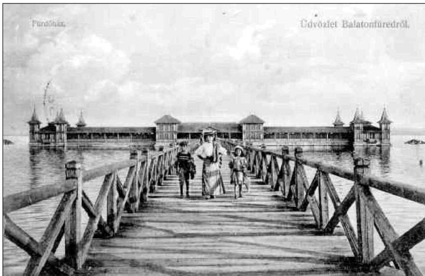
A balatonfüredi fürdőház látképe